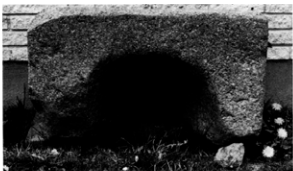
Fig. 1. Romansk *vinduesoverligger, formodentlig fra den nedbrudte †kirke (s. 2086). - Romanesque lintel, supposedly from the demolished †church.

Bygningen, hvoraf nu intet er synligt, menes at have ligget vestligt i landsbyen i den gamle skolehave, nord for den tidligere annekspræstegård. 4 På matrikelkortet 1784 (fig. 2) anes endnu kirkegårdens omrids. En romansk *vinduesoverligger (fig. 1) af granit, vandret afsluttet og 23 cm bred i den rundbuede lysning, opbevares