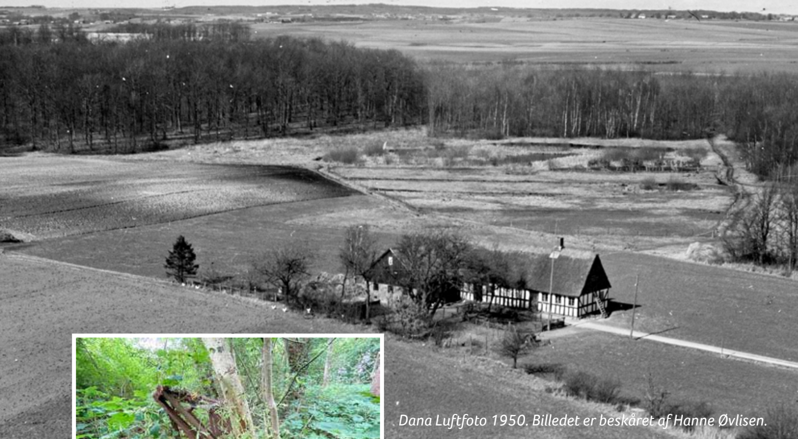
Dana Luftfoto 1950. Billedet er beskåret af Hanne Øvlisen.