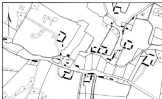
Fig. 2. Landsbyplan af Høver by 1:10000, 1782. X angiver den nedbrudte †kirkes formodede beliggenhed. - Map of Høver village 1782. X marks the supposed site of the demolished †church.