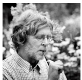
SØREN RYGE PETERSEN